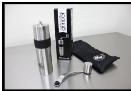
Im Transportsack befindet sich der Griff