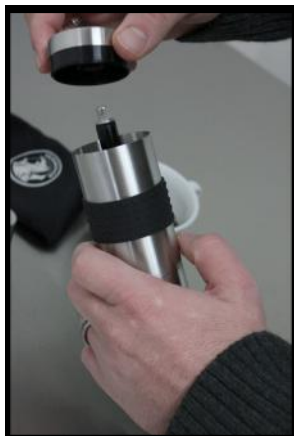
Den oberen Teil öffnen und die Bohnen einfüllen